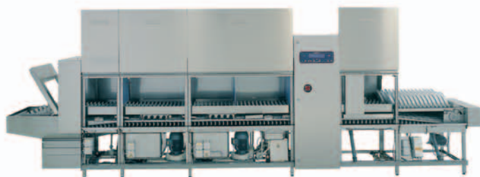
Soluzioni su misura

Il Programma R&S offre tutti i vantaggi delle migliori soluzioni per il lavaggio delle stoviglie e dei tessuti senza le limitazioni imposte dai budgets. Permette di non investire grosse somme di denaro in un'unica soluzione e di avere l'assoluta certezza dei costi per l'intera durata del periodo di noleggio.